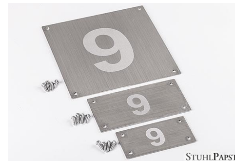
HAR.MONIE Nummerierung schraubbar