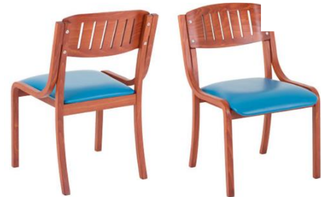
EXQ.UISIT SI Clinic