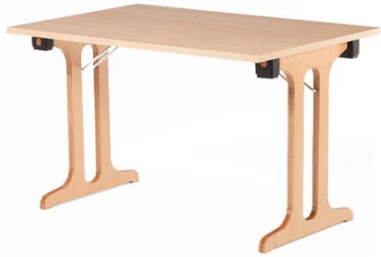
COM.FORT de Lux Tisch