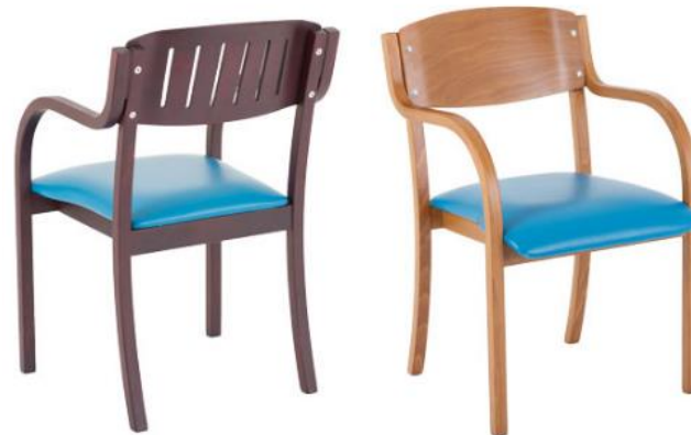
EXQ.UISIT SI AL Clinic