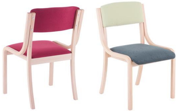
EXQ.UISIT de Lux