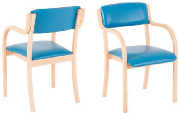
EXQ.UISIT de Lux AL Clinic