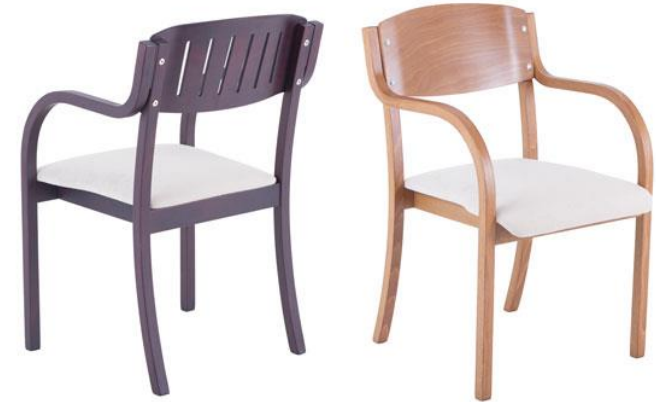
EXQ.UISIT SI AL